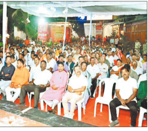
कार्यक्रम को संबोधित करते मुख्यमंत्री एवं उपस्थित नागरिक।

लिए साधुवाद दिया। कालरात्रि, महाशिवरात्रि के बाद दीपावली की बेला में सुखरात्रि आती है जो जीवन में शांति सुख व समृद्धि लेकर आती है। भारतीय जनता पार्टी के हर कार्यकर्ता का लक्ष्य स्वयं के सुख की कामना का नहीं होना चाहिए। समाज के सुख की कामना के साथ उन्हें लक्ष्य की ओर अग्रसर होना चाहिए। समाज के सबसे अंतिम व्यक्ति को हम समर्थ सशक्त बनाएं इस दिशा में हमारा प्रयास होना चाहिए। पांडित दिनदयाल उपाध्याय के आत्मवाद, भारत दर्शन के सिद्धांत की व्याख्या करते हुए उन्होंने वैचारिक क्रांति की बात कही। भाजपा के कार्यकर्ताओं को राष्ट्रभक्ति, देशभक्ति के जच्चे के साथ जन